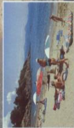
PLAGE DE LA GAILLARDE - A 50 M